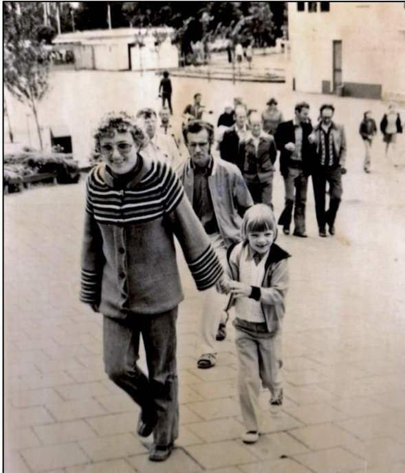
Skoallereiske nei Dolfinarium, Hurderwyk, 1977

Wat ik nea ferwachte hie, wy wûnen de earste priis! Dat moasten wy fiere! Ik ha myn lytse 'helden' trakteare! Hja hiene it fertsjinne.