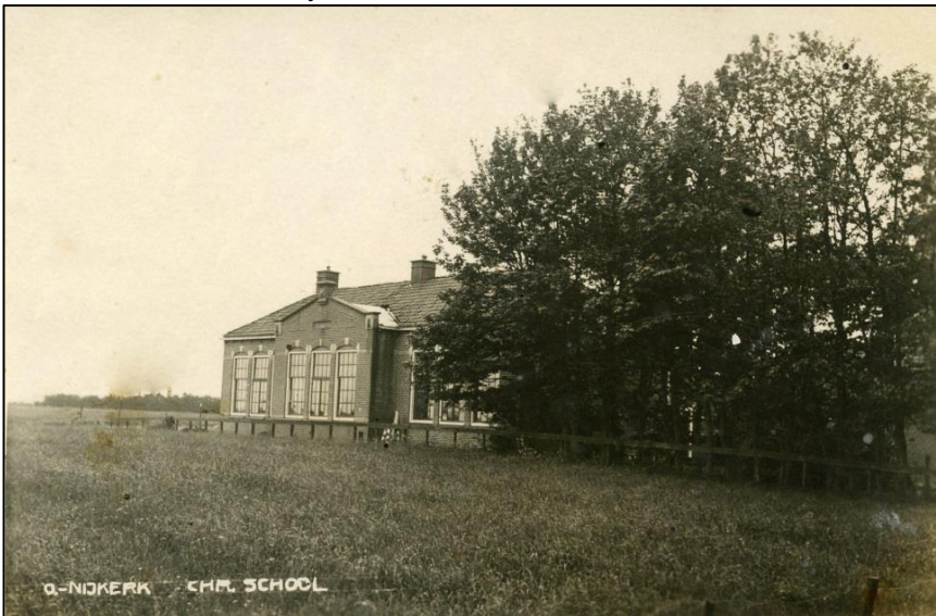
Efterkant skoallegebou fan 1902 yn 1934.