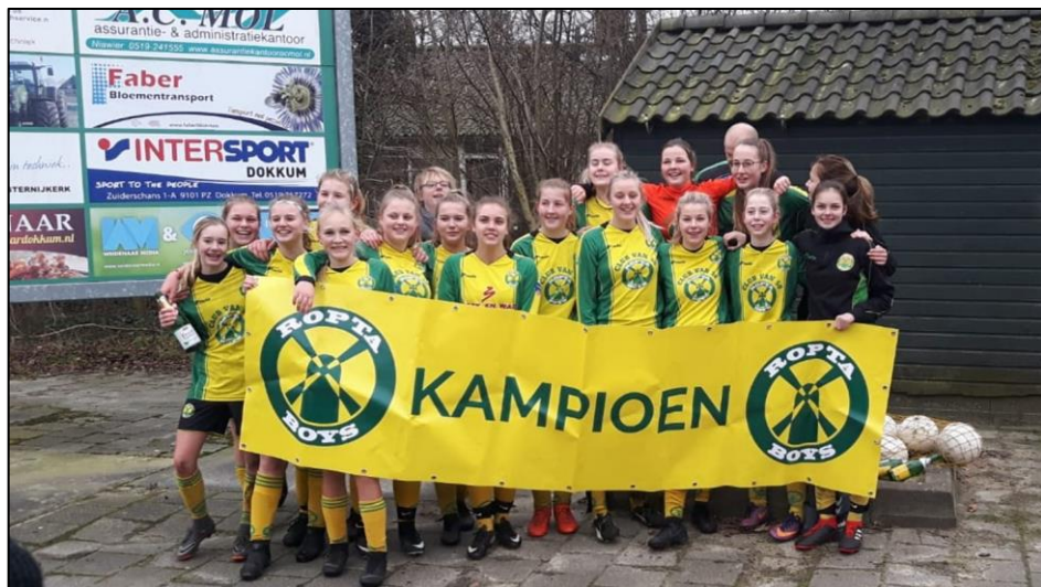
Ropta Boys MO17 zijn kampioen geworden! (15-12-2018)