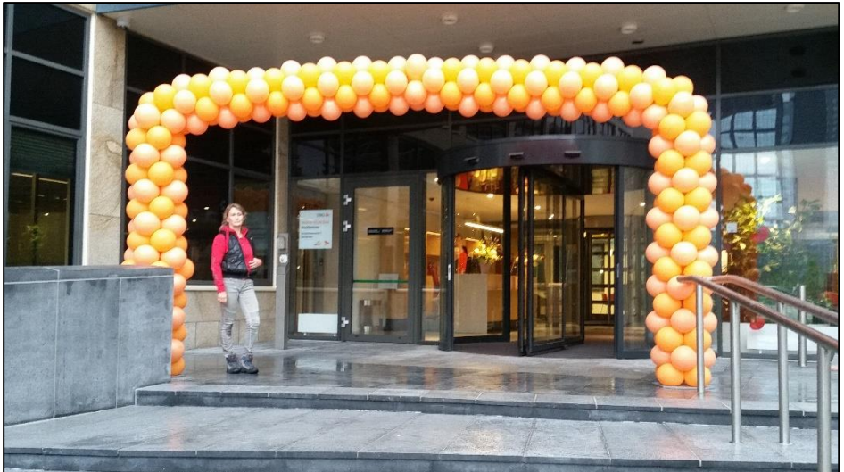
Dizze mega grutte ballonbôge is ferline jier makke foar de ING. In frije oerspanning fan mar leafst hast 6 meter.