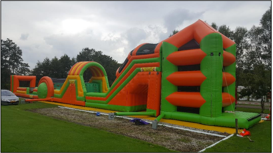
Dit is de Spiderweb survivalbaan - mear as 40 meter klim- en klauterwille!