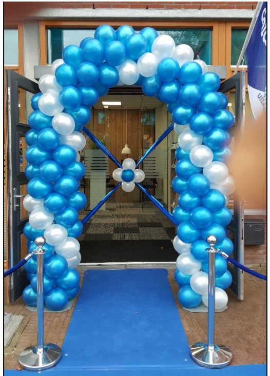
In ballonnenbôge mei in ballonnenstrik foar de iepening fan Abiant Feanwâlden