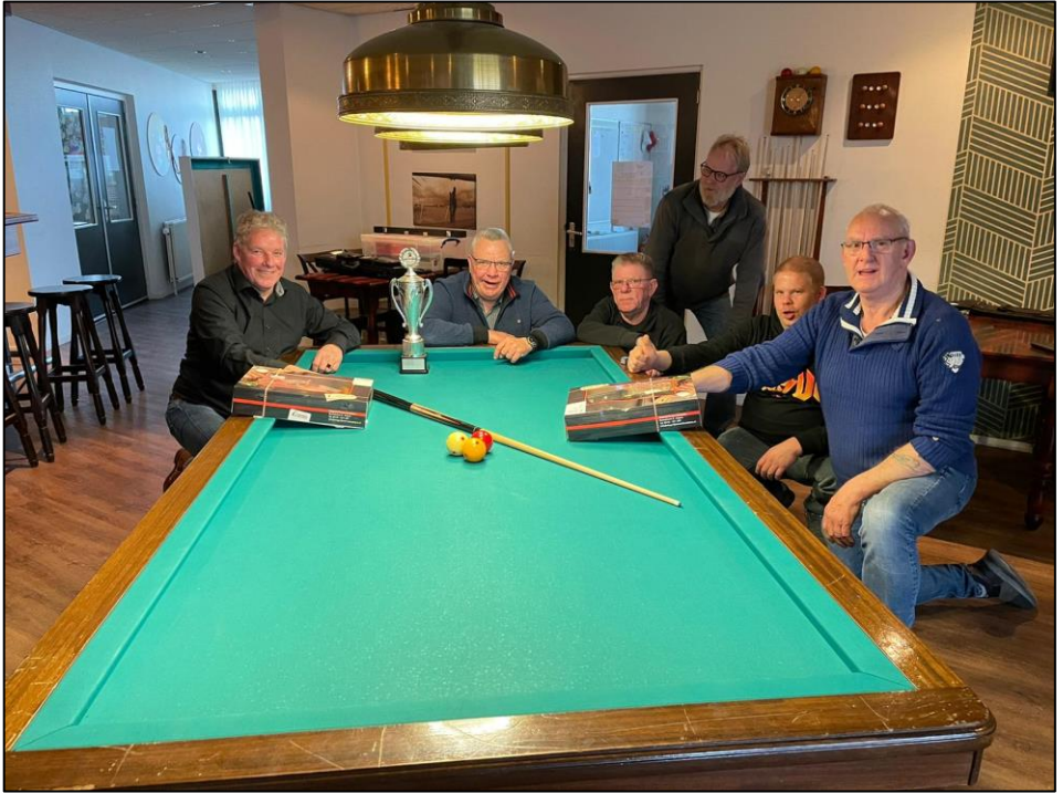
Biljarten 2022 10 over rood