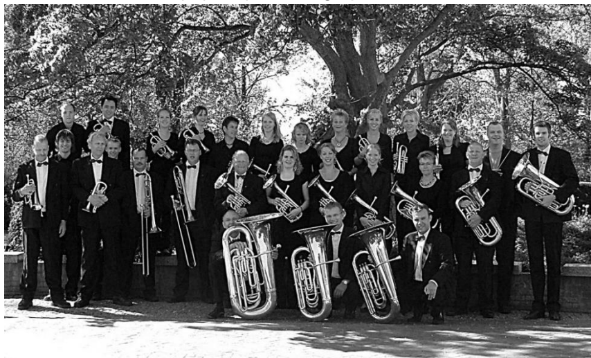
U.D.I. in het Bonifatiuspark te Dokkum, 2007.

De Brassband en Drumband verzorgen op speciale dagen zoals Koningsdag en bij het dorpsfeest muziek voor de dorpsgenoten. Ook de optredens rond kerst zijn jaarlijkse hoogtepunten.