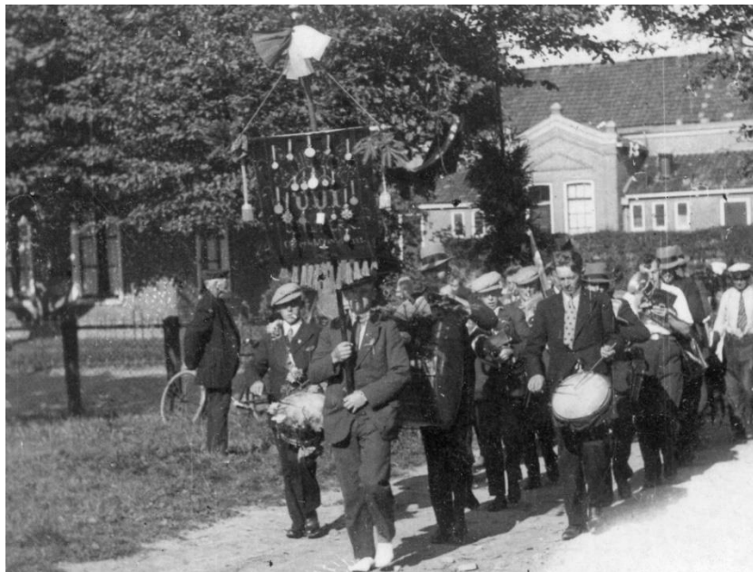
U.D.I. op weg naar het feestterrein op Lou Sânen met op de achtergrond de Openbare School, 1938.