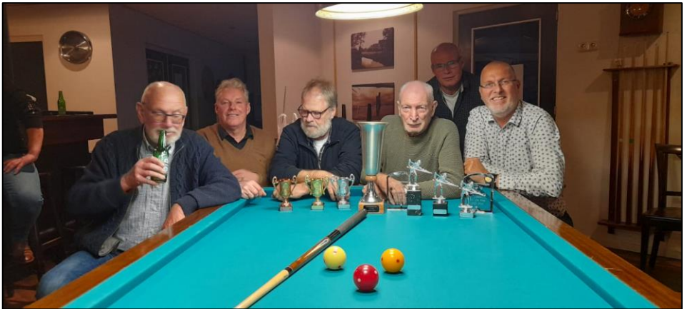
Biljarten competitie 2021-2022